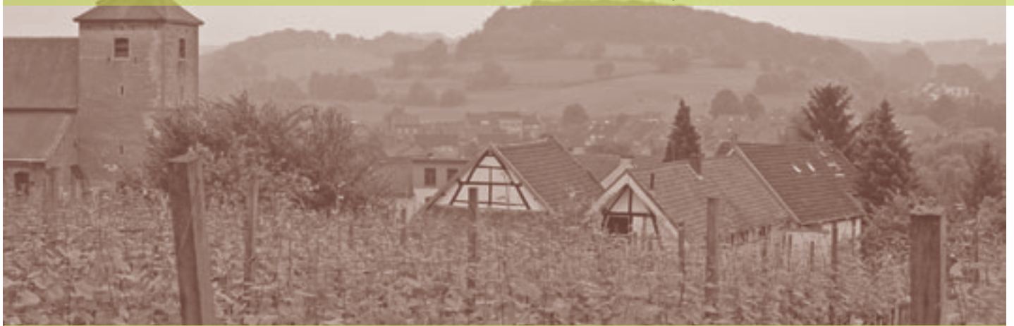
"Schin op Geul één van de eerste dorpen in regio Zuid-Limburg met een DOP"

Na het maken van een DOP begint pas het echte werk