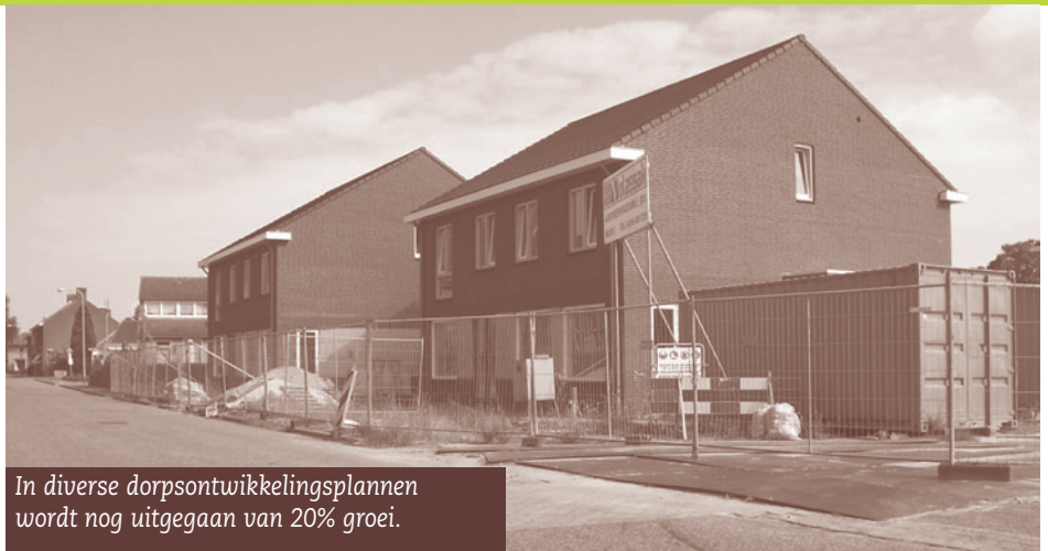
In diverse dorpsontwikkelingsplannen wordt nog uitgegaan van 20% groei.

Het begint zo langzamerhand door te dringen dat de bevolkingsdaling niet beperkt blijft tot enkele regio's in Zuid- en Noord-Nederland. Het vorige kabinet heeft in het Interbestuurlijk Actieplan Bevolkingsdaling aangegeven enkele experimenten te willen ondersteunen om kansrijke projecten te ontwikkelen in regio's die te maken hebben met bevolkingskrimp. Op 21 januari vond in Zuid-Limburg een regiobijeenkomst plaats waar de VKKL gevraagd werd om in te gaan op het belang van bewonersparticipatie en bevolkingsdaling. Hieronder een verkorte weergave van de inbreng van de VKKL